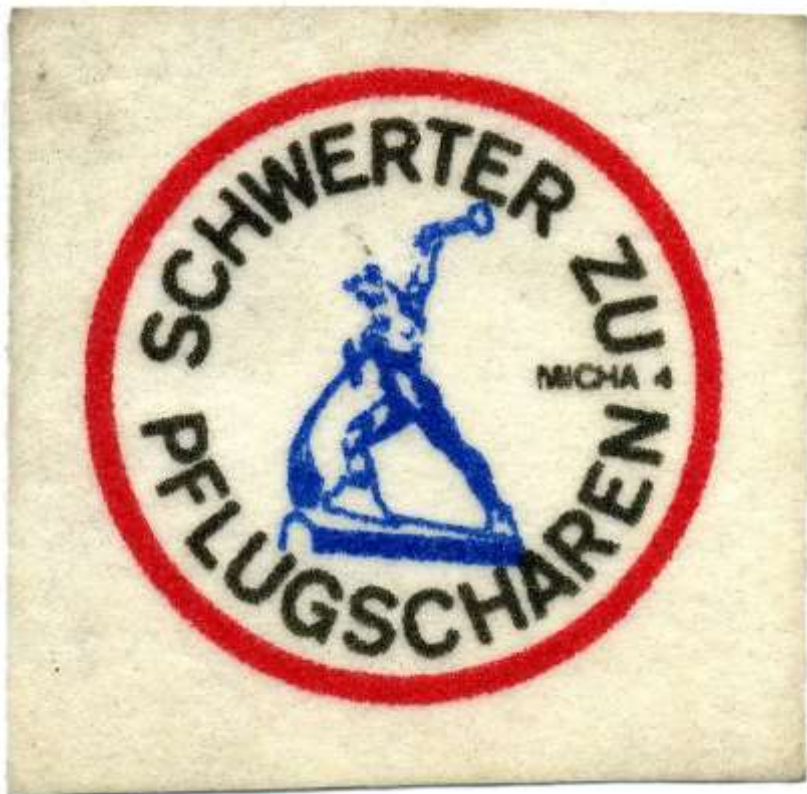
Aufnäher: Schwerter zu Pflugscharen von 1982:Foto: Eberhard Bürger.