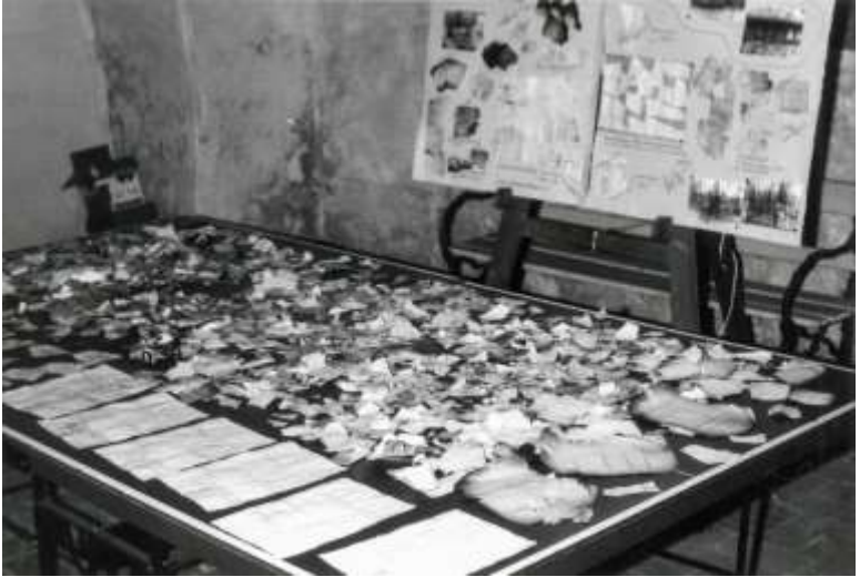
Ausstellung von Fundstücken aus der Stasi-Zentrale bei Belgern/Elbe in der Kirche von Belgern, Januar 1990.