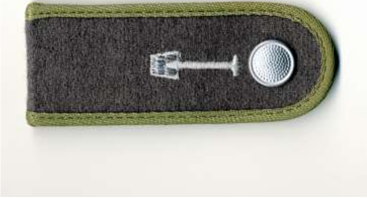
Achselstück von Bausoldaten in der DDR.