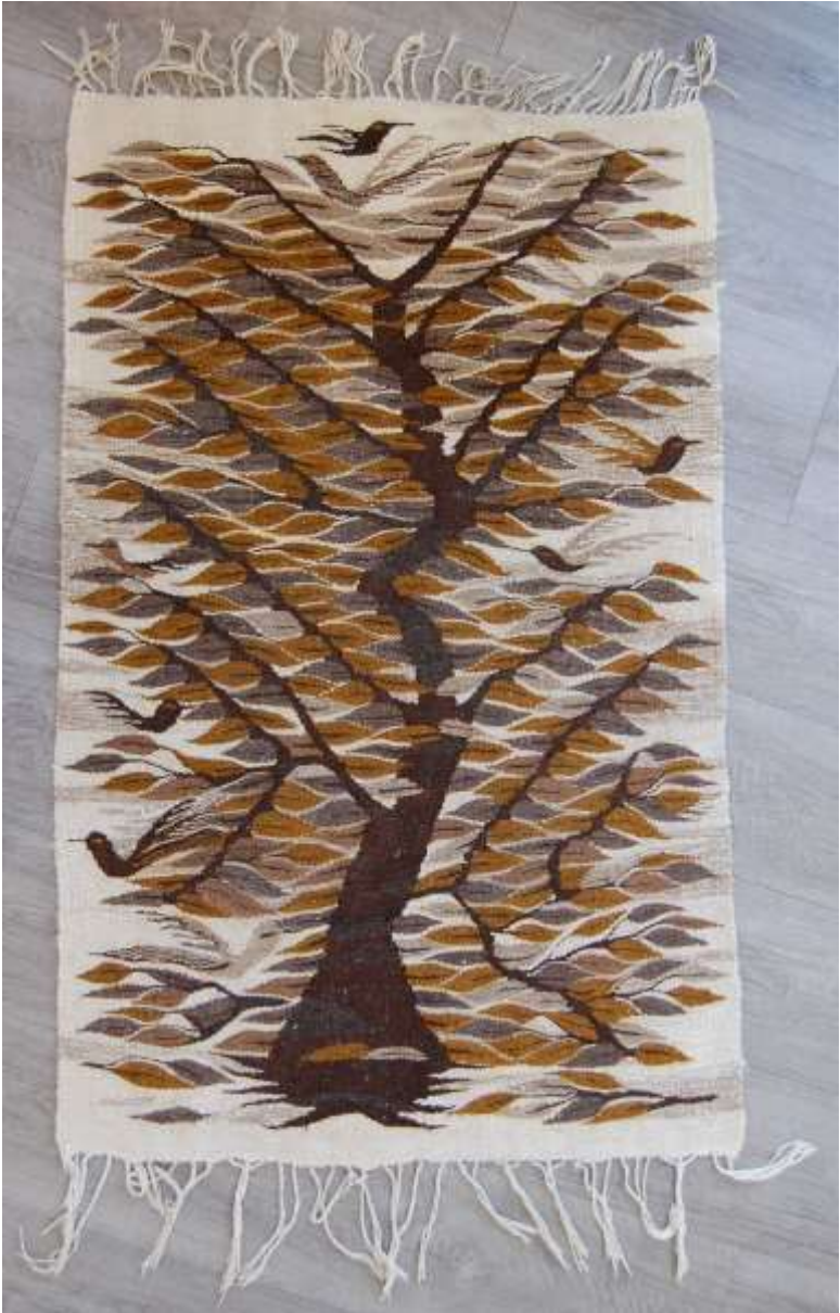
Ägyptischer Wandbehang „Die Vögel des Himmels finden Schutz unterm Blätterdach“, vgl. Mk 4,32. Aus einem Sozialzentrum der Caritas-Kairo.