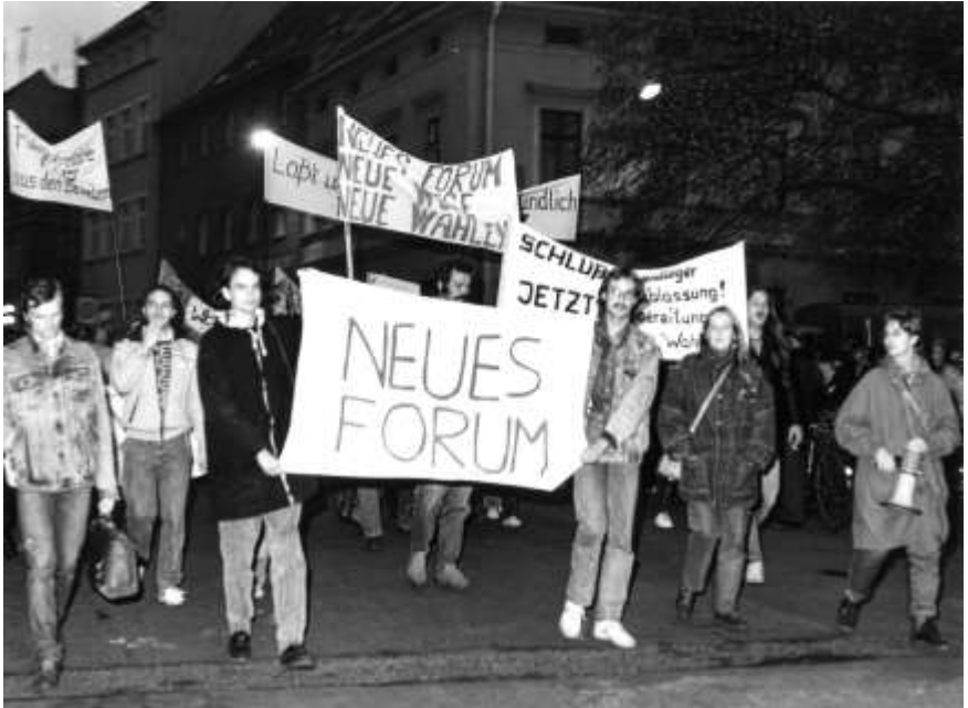
Demonstration im Anschluss an ein Friedensgebet in Torgau.