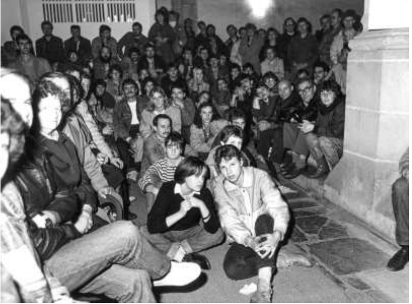
Erstes Friedensgebet September 1989 Stadtkirche Torgau. Foto: Erdmute Bräunlich. Mit freundlicher Genehmigung.