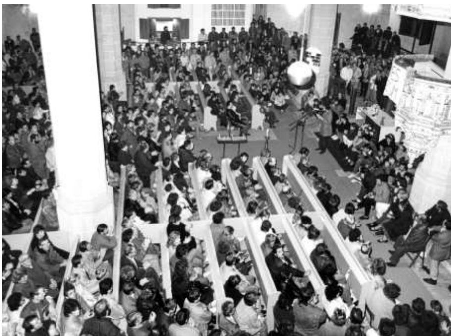
Erstes Friedensgebet September 1989 Stadtkirche Torgau.